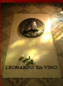
Sépulture de Léonard de Vinci au Château royal d'Amboise